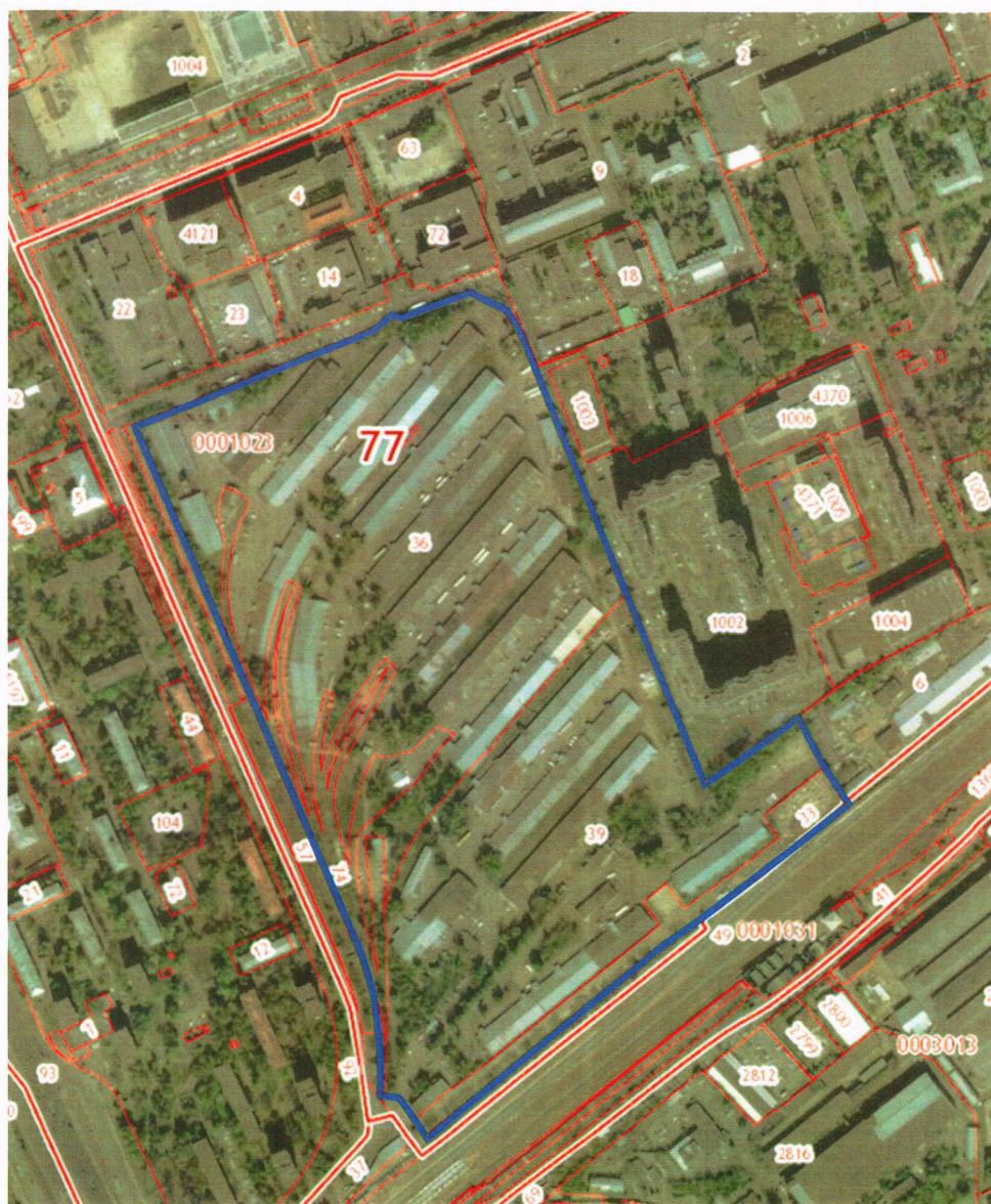
Схема границ территории, расположенной в производственной зоне № 44 «Братцево», в отношении которой принято решение о комплексном развитии территории по инициативе Правительства Москвы